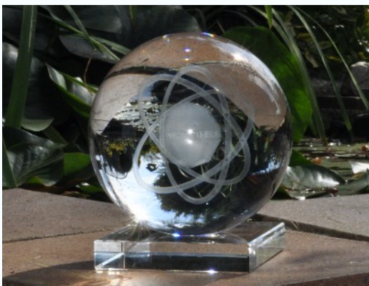
Koule - optické křemičité sklo české produkce. Logo PROMETHEUS 20-ti stěn s 3 orbity.

ŽIVÁ VODA - jedná se o přirozený stav vody, kterého je dosahováno díky velkým tlakům a spirálovitému pohybu vody při vyvěrání ze zemského podloží. Díky tomuto principu se u vyčerpané povrchové vody, obnovuje její správná hexagonální krystalová mřížka, obnovují se kovalentní vazby atd., na povrch se tedy vrací voda s tzv. uspořádanou strukturou.